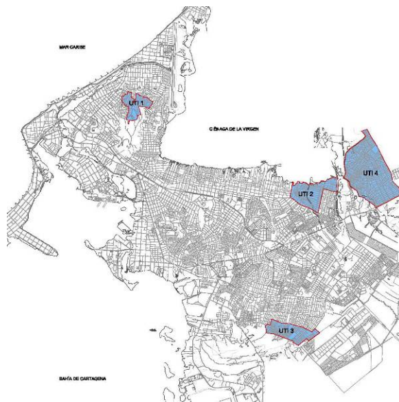
Localización de las UTIs en la ciudad de Cartagena

UTI 3: Sierrita, Villa Fanny y Nueva Villa Fanny, Nueva Jerusalén, El Silencio, Los Santanderes, Nazareno, Esmeralda I Esmeralda II, La Gaitana, Manuela Vergara de Curi, Jaime Pardo Leal, Sor Teresa de Calcuta, 2 de Noviembre, Buenos Aires, Barrio Nuevo e India Catalina.