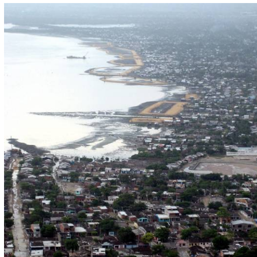
Vista del barrio Olaya Herrera y la Ciénaga de la Virgen desde el Cerro de la Popa

Esta profundización de los problemas de pobreza en la ciudad de Cartagena de Indias en la última década y el cuadro de deterioro de las condiciones de vida de su población fue la que llevó al PNUD a iniciar el PROGRAMA DE DESARROLLO LOCAL Y PAZ CON ACTIVOS DE CIUDADANÍA DE CARTAGENA desde el 12 de Julio de 2005, junto a la Presidencia de la República – Acción Social y la Alcaldía de Cartagena, incorporándose posteriormente la Agencia Española de Cooperación Internacional (AECI), y cuyo objetivo principal es promover el desarrollo local para disminuir las condiciones de extrema pobreza, mejorando las condiciones generales de vida, garantizando los derechos de ciudadanía con base en los principios de Desarrollo Humano.