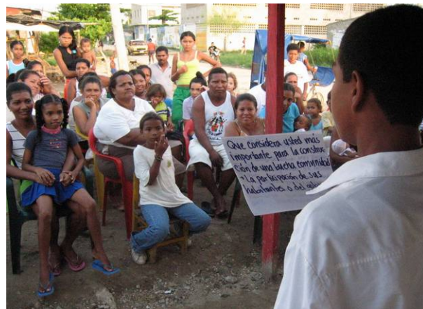
Taller de sensibilización sobre el Programa en la UTI 4