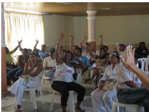
Taller de elaboración del Plan Local UTI 2

En esta fase se elabora un diagnóstico participativo de las condiciones del territorio en base a una encuesta realizada en cada vivienda, para posteriormente identificar proyectos que den respuesta a las principales necesidades detectadas.